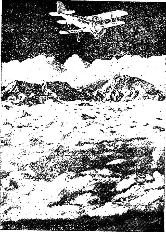
हिमालयपर हवाई चढ़ाई

उस समय एवरेस्टके चारों ओर ज़बरदस्त धुन्ध छाया हुआ था। धुन्धके कारण आसपासकी चीज़ोंको देखना भी मुश्किल था। दोनों